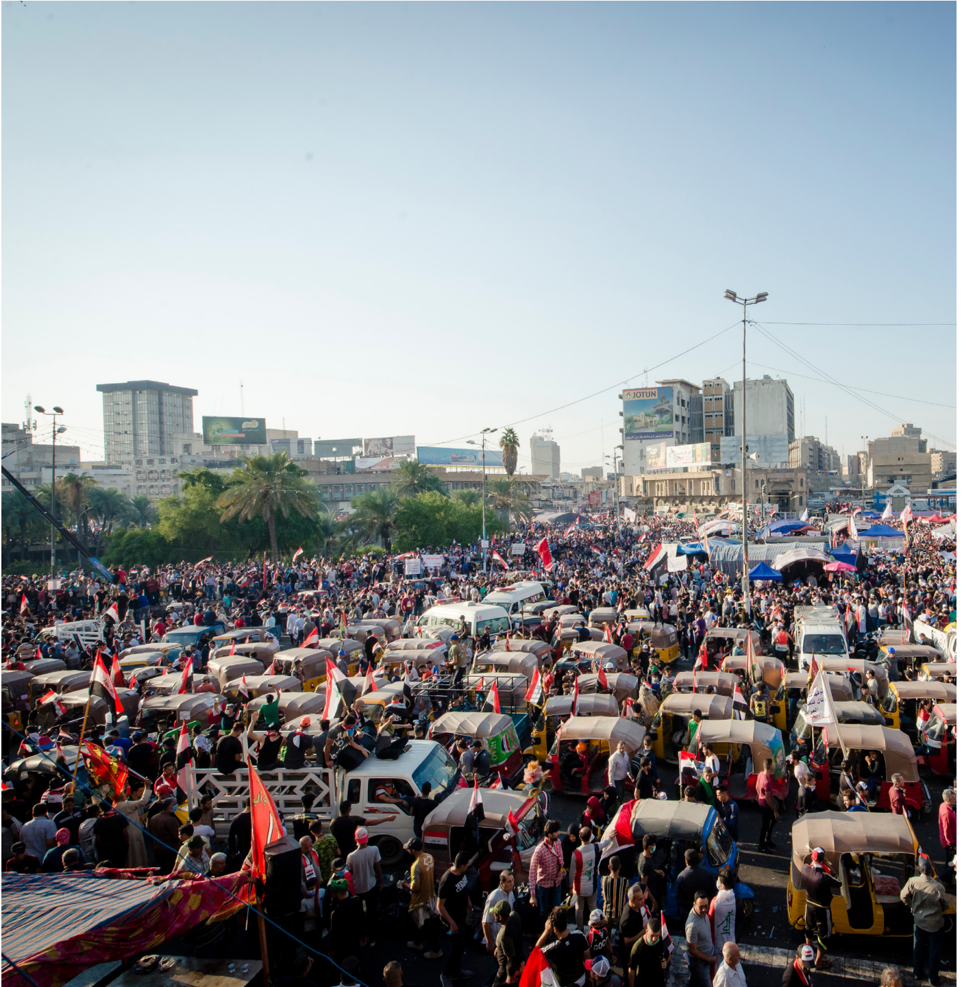
Figure 2: Anti-government protests in Baghdad's Tahrir Square, on 1 November 2019.

يميل الأفراد ذوي المعتقدات السياسية القوية إلى أن ينظروا إلى المحتوى الإعلامي على أنه معادي لوجهة نظرهم. سيرى مستخدمو وسائل الإعلام الحزبية أن التغطية الإعلامية أكثر تحيزاً ضد معتقداتهم أكثر من مستخدمي وسائل الإعلام غير الحزبية. كلما كان الاستقطاب أقوى، كلما كان تأثير النظرة العدائية لوسائل الإعلام أقوى بغض النظر عن التغطية التي قد تكون متحيزة أو غير متحيزة.