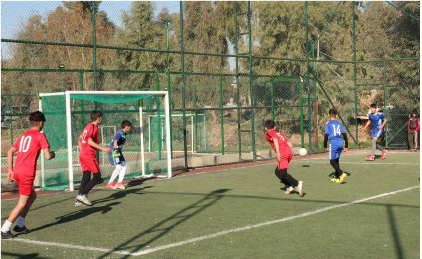
Figure 1: Food for Social Cohesion - various football teams in Tel Afar city came together to form a new team, with a mixed ethno-religious backgrounds, to play in a tournament.

ويعد محو الأمية الإعلامية أحد هذه المدخلات لبناء القدرات الإعلامية بين المواطنين. وفي العراق، كان هذا الموضوع هامًا للجهات الفاعلة الإنسانية والإنمائية. وفي عام ٢٠١٧، أجرت مؤسسة "وسائل الإعلام في سياق التعاون والمراحل الانتقالية" دراسة لفحص مستوى محو الأمية الإعلامية بين مستهلكي وسائل الإعلام العراقيين. أبرزت نتائج الدراسة أن مهارات محو الأمية الإعلامية الأساسية، مثل إجراء مقارنة بين المصادر وفهم التوازي السياسي (في الوقت الذي تتحكم فيه الأحزاب أو غيرها من المجموعات السياسية في المنافذ الإعلامية وتستخدمها لتكون ناطقة بلسان الحكومة) كانت سائدة بين أولئك الذين أجري عليهم المسح. وعلى وجه الدقة، ذكر ما يربو على ٧٠٪ من المجيبين أنهم يستخدمون مصدرين أو أكثر للعثور