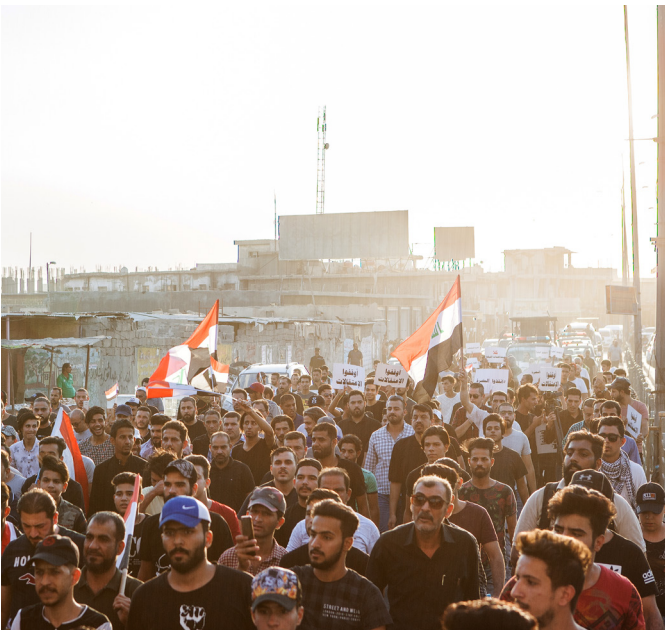
Figure 3: Following a water crisis in southern Iraq, hundreds of protestors take to the streets of Basra on 25 September 2018 to denounce the lack of public services.